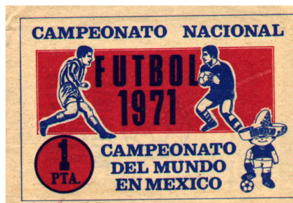
Sobre de cromos