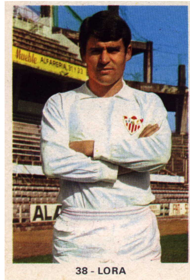
5 x 7,5 cms.

Colección correspondiente a la temporada 1970-71, formada por 300 cromos en papel, numerados e identificados por delante y de tamaño 5 x 7,5 cms. Hay 18 casillas en las que existen 2 jugadores compartiendo número y 1 casilla en que existen 3 jugadores. Por tanto, el número total de jugadores serían 320. También hay 7 jugadores con error en el nombre o doble número y que existen también corregido, por lo que si lo quieres tener todo la colección completa serían 327 cromos. Los últimos 16 cromos son en formato apaisado y corresponden a las selecciones participantes en el recién finalizado campeonato del mundo de selecciones de Méjico 70. El álbum mide 24'5 x 34 cms.