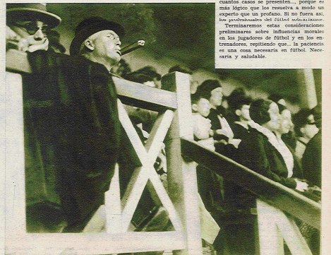
... explicando también como debe "construirse" las jugadas para que sean eficaces y de mayor rendimiento. Todo, según mi modesto saber futbolístico.

Terminaremos estas consideraciones preliminares sobre influencias morales en los jugadores de fútbol y en los entrenadores, repleto que, la palabra es una cosa necesaria en fútbol. Necesaria y saludable.