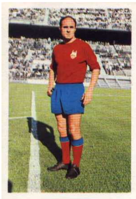
5,2 x 7,6 cms.

Álbum con los equipos de las divisiones de oro y plata del fútbol español de la temporada 1968-69. El álbum está dividido en dos secciones, una para cada división, siendo los cromos de diferente tamaño y diseño en cada caso. El álbum mide 31 x 21'5 cms., y contiene en sus primeras páginas el palmarés de los campeones de Liga y Copa, así como el calendario de la temporada y una tabla de clasificación para rellenarla a lo largo de la temporada. Los equipos de primera están representados por 18 cromos, el escudo y 17 cromos, aunque en algunas posiciones admiten a más de un jugador. Estos cromos son a color, de cuerpo entero e identificados por detrás con el nombre del jugador y el equipo. Sus dimensiones son 5'2 x 7'6 cms. Los equipos de segunda división están representados por 13 bustos de jugadores, con dos jugadores en algunas posiciones. Estos cromos también están identificados por detrás del mismo modo que los de primera y sus dimensiones son 2'9 x 4'1 cms.