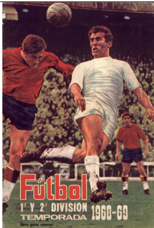
31 x 21,5 cms.