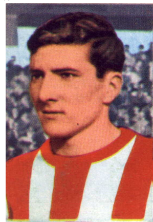
2,9 x 4,1 cms.