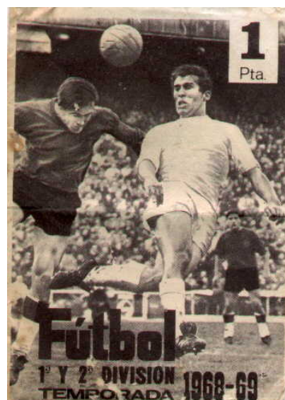
Sobre de cromos

Ufarte Irureta Luis Gárate Adelardo Cardona Correa Collar Hernández Barcelona C.F. Escudo Sadurní Reina Franch/Torres Gallego Eladio Oliveros Zabalza / Fernández Mendonça Fusté Rexach Palau Pellicer/Castro Zaldúa Rifé Pereda Juan Carlos Juanito