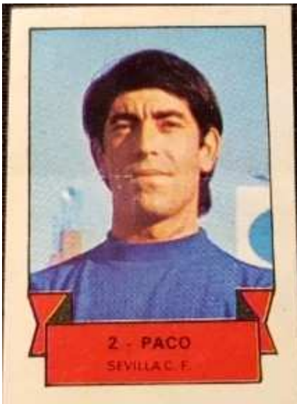
2'5 x 3'5 cms.

Rarísima colección del año 1975 editada por la empresa distribuidora sevillana Segimar-Rosielo, dedicada a las golosinas, pastelitos industriales y frutos secos. Los cromos tienen un diseño idéntico a los de la colección de 1970 de Topps-Tardá, numerados e identificados por delante con el nombre del jugador y el equipo, mientras que en la trasera llevan información sobre los premios que se podían obtener completando los equipos. Seguramente cada equipo se coleccionaba en un álbum diferente y debería existir un "cromo imposible" por equipo. Estos eran los premios: FC Barcelona (una guitarra), Real Madrid (un tren eléctrico), Real Betis (una máquina fotográfica) o Sevilla FC (una bici de niño). Los cromos miden 2'5 x 3'5.