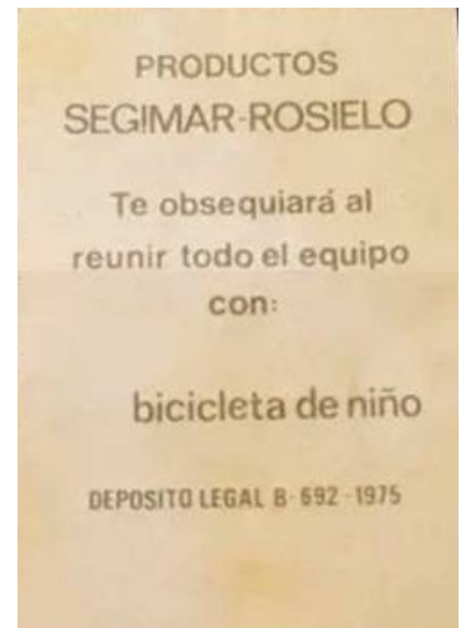
Ejemplo de una trasera