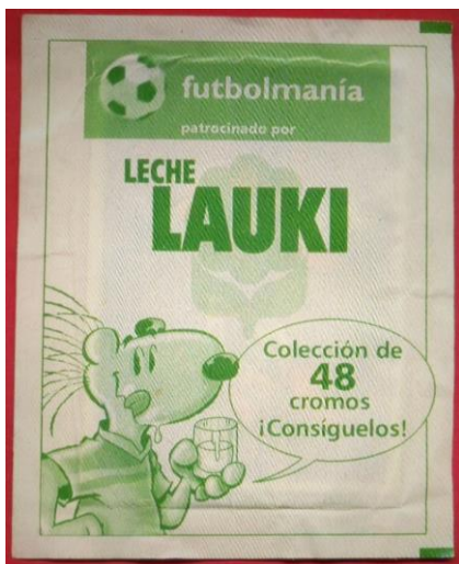
Sobre en que salían los cromos