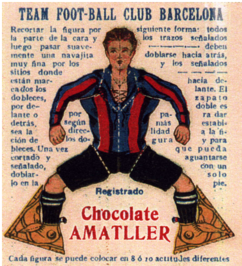
7 x 6,5 cms.

Curiosa colección recortable que constaba de 4 cromos: 2 futbolistas, 1 portero y un entrenador. La imagen del dorso es la de la parte trasera del mismo jugador. El jugador se recortaba y doblándolo adecuadamente tomaba una posición dinámica de juego. Tamaño 7 x 6,5 cms.