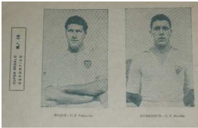
XX x XX cms.