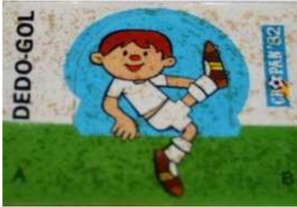
6 x 4 cms.

La celebración en España del Mundial '82 disparó el número de colecciones. Cropán sacó este juego con cromos llamado Dedo-Gol. Cada cromo lleva un jugador de una selección participante, con la intención de que el coleccionista conforme un equipo y pueda jugar al "Dedo-Gol". Los cromos de tamaño 6 x 4 cms., estaban semitroquelados, y tras eliminar la parte blanca, se ponían en el dedo índice uniendo las letras A y B para después chutar con la uña.