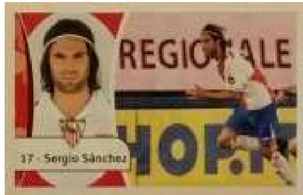
XX x XX cms.