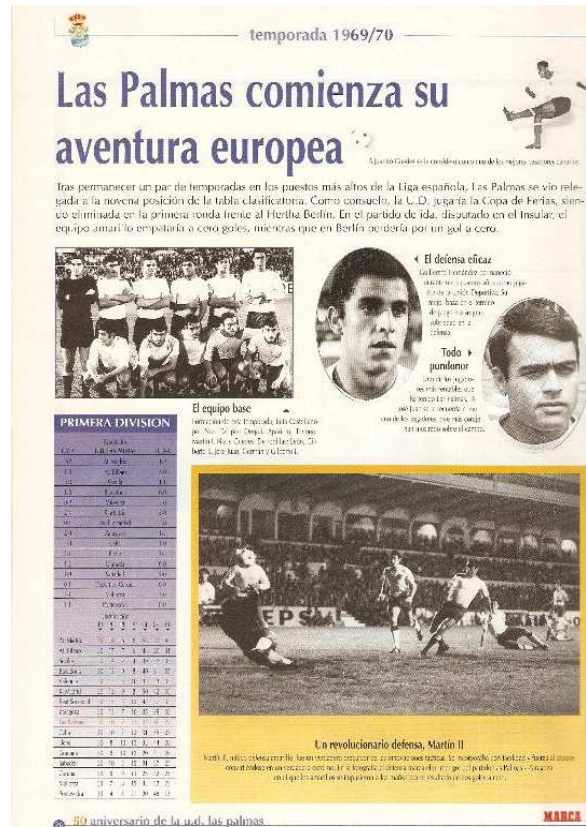
Aspecto de una de las páginas del álbum