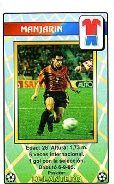
5'6 x 8'7 cms.

Juego de 33 cartas que incluye jugadores de la selección y eventos típicos de un partido. Las cartas miden 5'6 x 8'7 y van identificadas con el nombre del jugador, su demarcación y una ficha técnica.