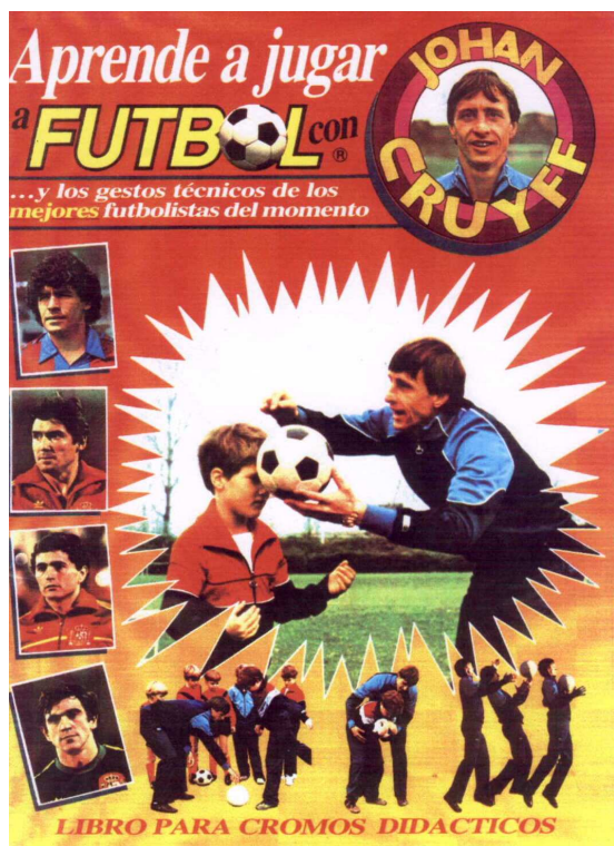
25,5 x 35,5 cms.