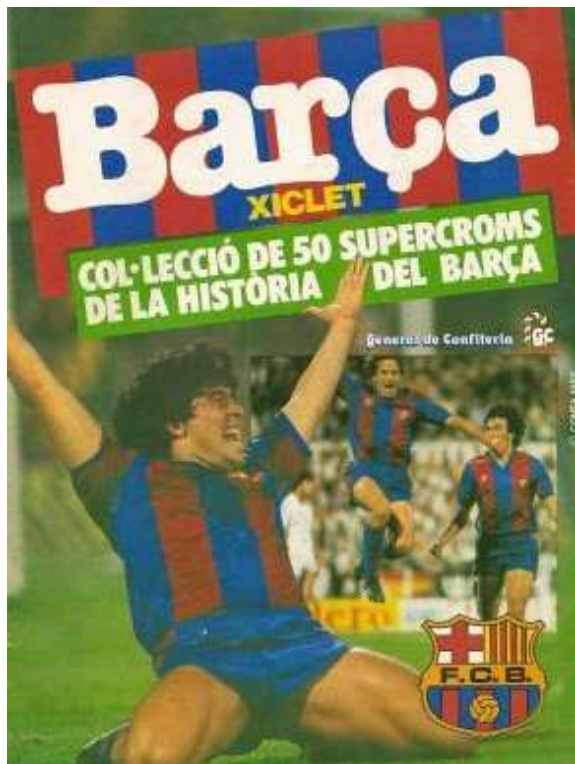
15 x 20 cms.