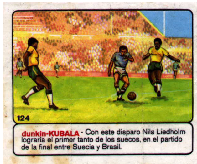
6'6 x 8'1 cms.