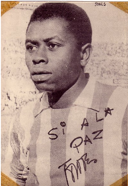
10,3 x 14,8 cms.