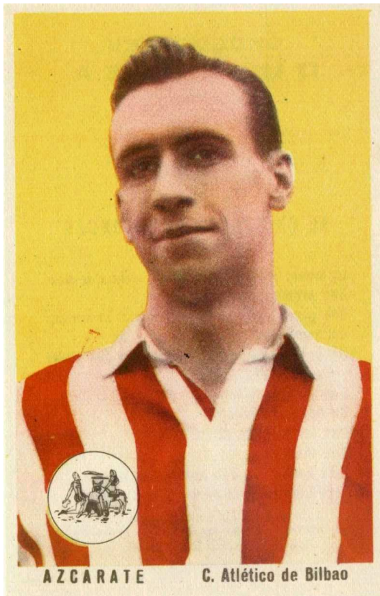
6'7 x 10'5 cms.

12 cromos por cada uno de los 7 equipos de primera que salen en esta colección. Los cromos miden 6,7 x 10,5 cms. y en el dorso además de la publicidad de los Chocolates Dulcinea de Quintanar de la Orden, salen los regalos que se consiguen al completar la colección.