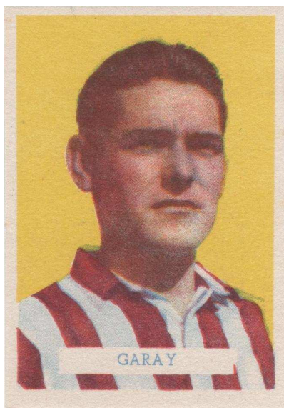
5,6 x 8 cms.

Se conocen cromos similares con propaganda de Chocolates Nieto pero satinados, así como de otras marcas.