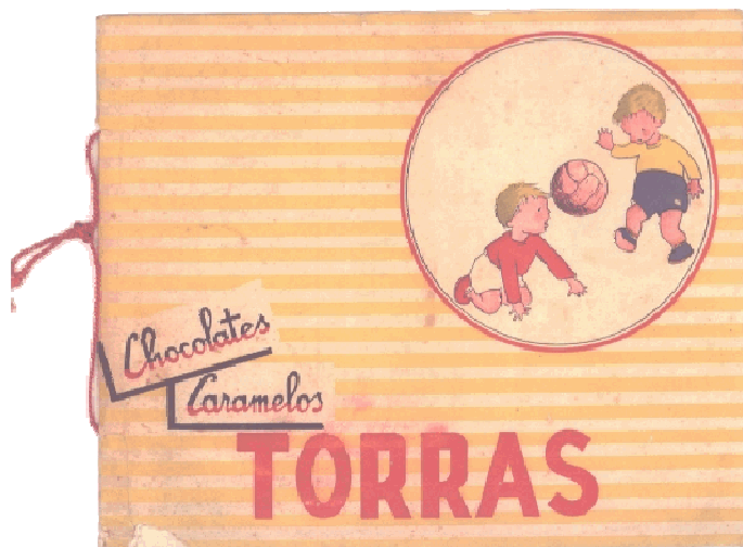
24,8 x 20,5 cms.