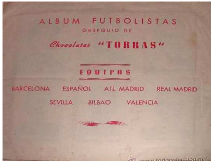
Contraportada del álbum