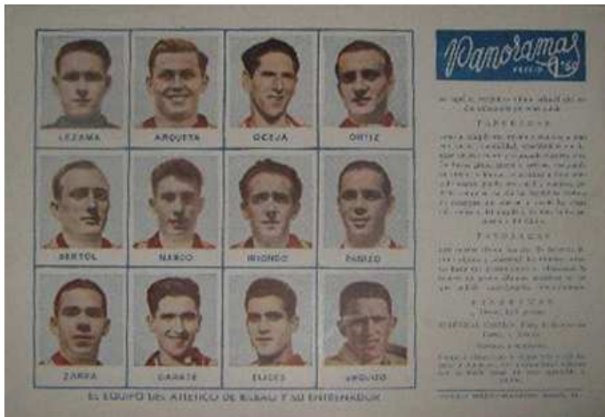
24 x 17 cms.