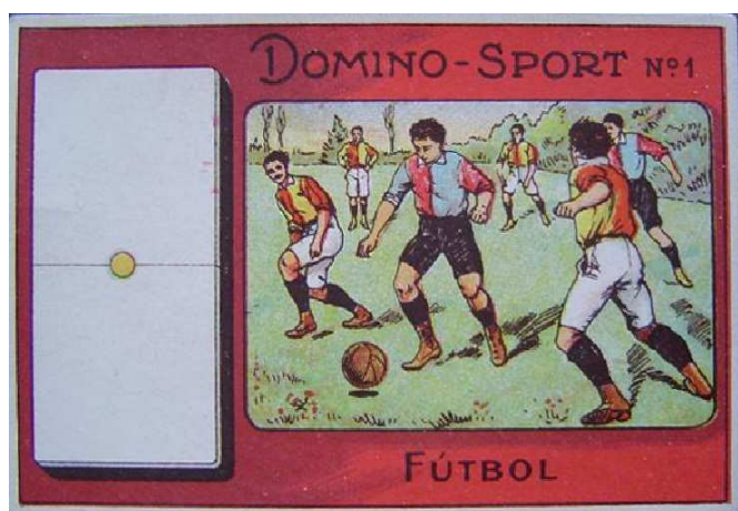
XX x XX cms.

Colección de 28 cromos, incluyendo una escena deportiva alusiva a un deporte, identificado al pie del cromo, y una ficha de dómينو, completando el juego completo del dómينو, con sus 28 fichas. Una de ellas está dedicada al fútbol.