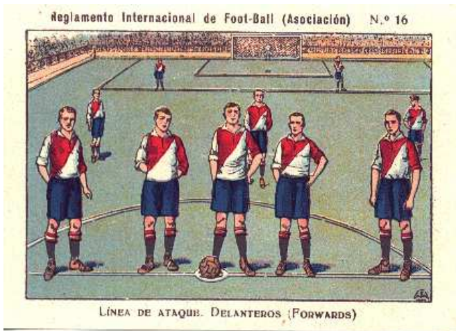
11 x 7,5 cms.