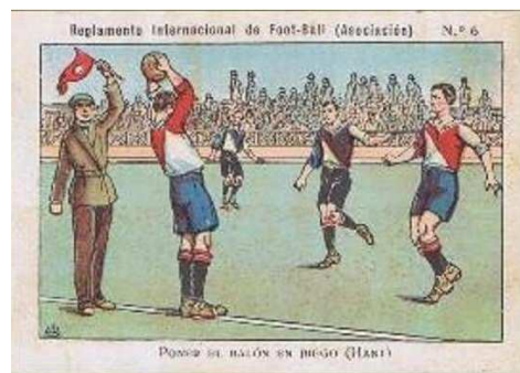
Las dos versiones ("derecha" e "izquierda") de un mismo cromo.