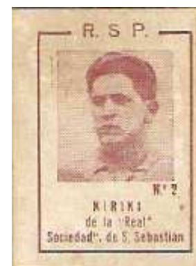
1,6 x 2,3 cms.