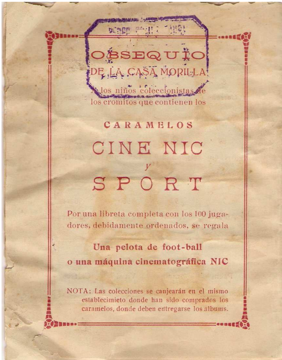
Contraportada del álbum, con las indicaciones de los regalos a conseguir