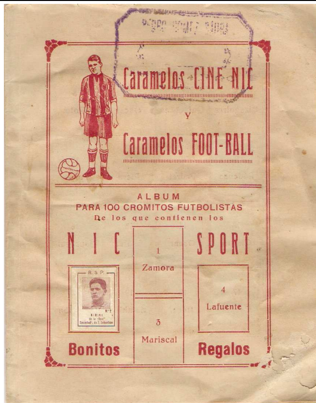
11 x 14 cms