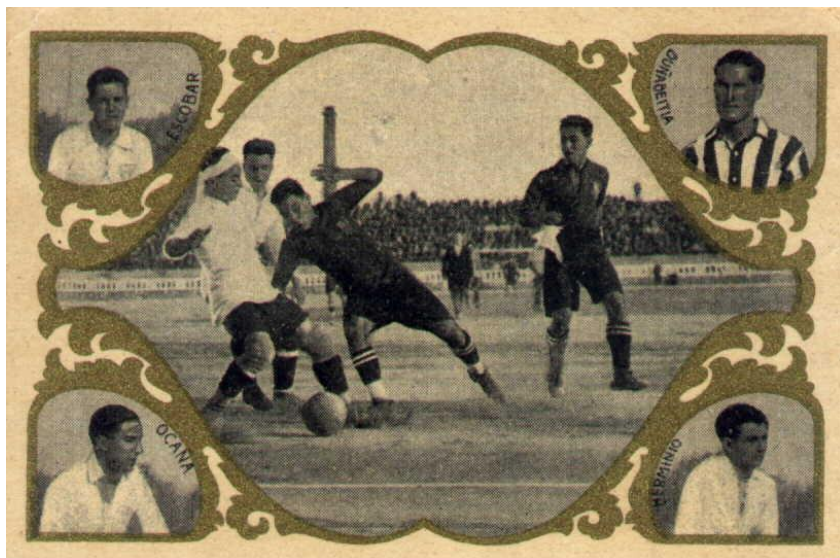
10,2 x 7 cms.

Colección de 20 cromos de dimensiones 10'2 x 7 cms., de orientación apaisada, con espacio libre en el dorso para la inclusión de publicidad. La colección fue editada por la litografía F. Riera Feliu, de Barcelona. Cada cromo presenta una escena futbolística y los bustos de cuatro jugadores, en casi todos los casos del mismo equipo; los cromos están numerados por detrás. Las fotografías son en blanco y negro y están enmarcadas en un trabajo artístico de color dorado. Los jugadores están identificados con su nombre en el anverso del cromo. En el dorso se habla de partidos cruciales de campeonatos de la época, como el Campeonato de España 1921-22 o los Campeonatos de España y de Cataluña 1922-23, así como partidos importantes entre equipos catalanes y del resto de España y el extranjero. Existe una variante en la que la orla artística es de color añil (probablemente debido a que no se le hizo la última pasada de imprenta para darle el color dorado a la orla), en lugar de dorado, siendo idénticas todas las otras características de los cromos.