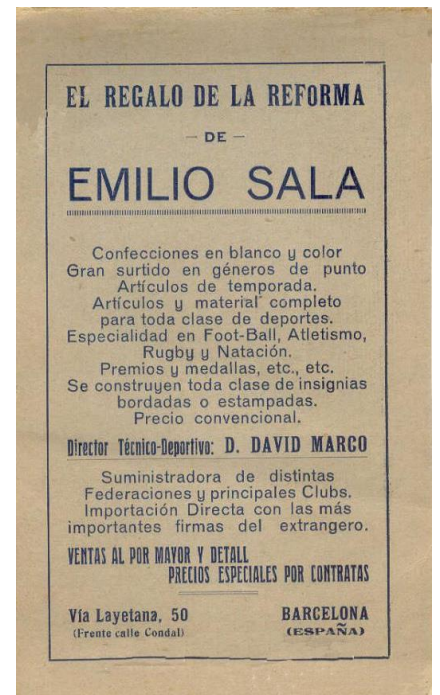
Dorso de uno de los sobres que incluían a uno de los equipos