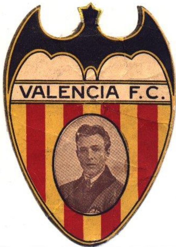
11'5 x 8 cms.