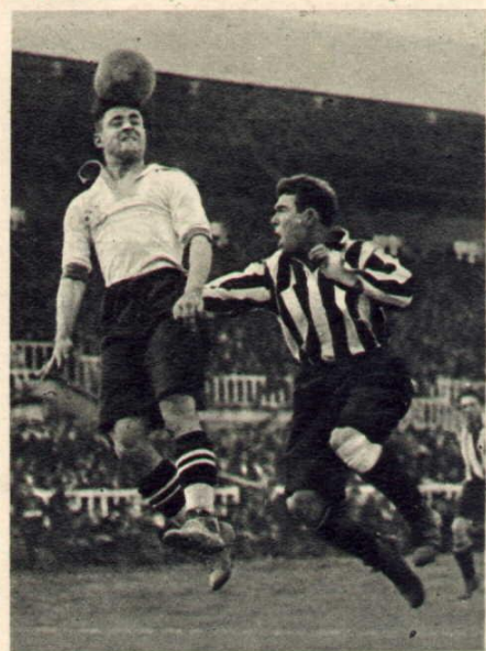
Travieso, intenta arrebatar a Serra el balón