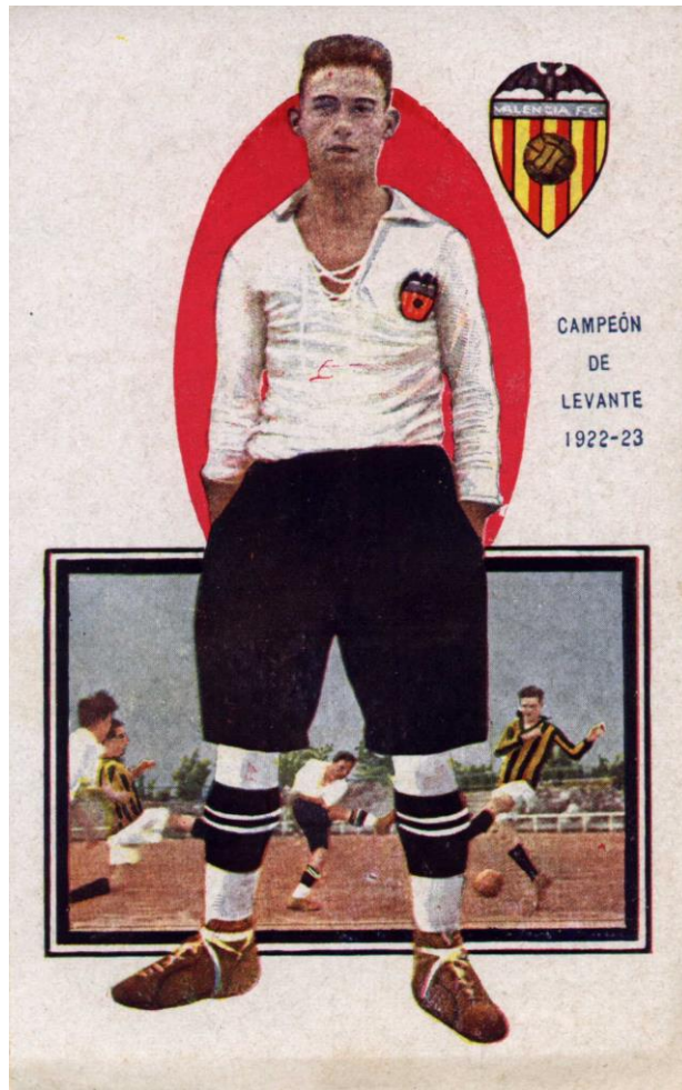
8 x 13 cms.

Preciosa colección de tarjetas postales a color que aparecían como obsequio en los Chocolates Amatller. Se publicaron varias series, dedicadas a equipos como Barcelona, Europa, Sevilla, Madrid, Athletic Club o Valencia, todos ellos ganadores de algún título regional o nacional. Cada postal presenta el escudo del club, una foto del jugador y una escena futbolística en la que aparece el mismo jugador. En el dorso aparece la serie y el número de orden de ese jugador, así como su nombre y una pequeña biografía. Cada serie constaba de once, doce o trece jugadores, según el equipo. En total 72 cromos. Las postales son de dimensiones 8 x 13 cms.